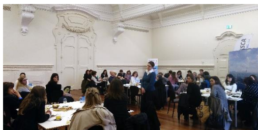
À Mesa por um Mar sem Lixo

Ao longo do ano, os coordenadores do PNVBA são convidados a participar nas atividades desenvolvidas pela Coordenação Nacional do Programa Bandeira Azul ou pelas entidades promotoras. Pretende-se que, mais do que vigilantes das praias, sejam ativos nas atividades de educação ambiental desenvolvidas. Além da Caça à Beata, o PNVBA colaborou ativamente no Praia Mais Limpa com, na Blue Flag Meed Week e este ano da nova atividade, Os Suspeitos do Costume.