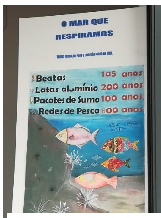
Ponta Delgada, São Vicente