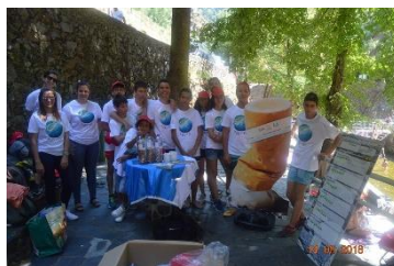
Praia Fluvial Senhora da Piedade, Lousã