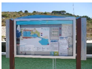
Marina de Albufeira

Nas visitas às marinas e portos de recreio, os coordenadores regionais têm uma check list própria, baseada nos critérios do programa, que se dividem em Informação e Educação Ambiental, Gestão Ambiental e Equipamentos, Segurança e Serviços, Qualidade da Água, Responsabilidade Social e Envolvimento Comunitário.