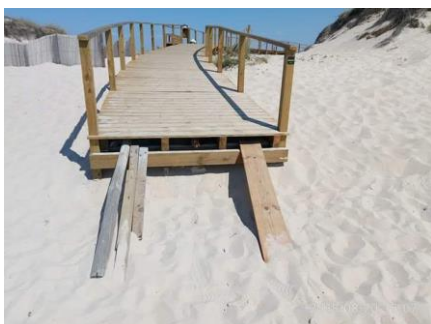
Poço da Cruz