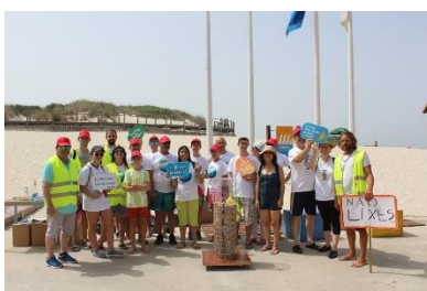
Praia da Barra, Ílhavo