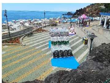
Cabeça Gorda, Funchal