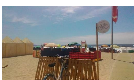
Baía 37, Espinho