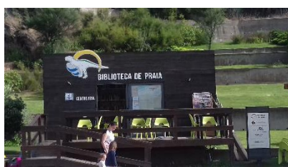
Areia Branca, Lourinhã