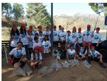
Praia Fluvial da Aldeia do Mato, Abrantes

As beatas destas ações são recolhidas pela Missão Beatão, ONG que se dedica a desviar as beatas de aterro e a estudar alternativas para revalorização deste resíduo.