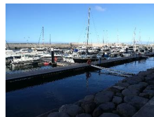
Porto de Recreio da Calheta

As Marinas e Portos de Recreio, tal como as praias, são visitados pelos coordenadores do PNVBA durante a época balnear para aferir se estão a ser cumpridos os critérios que permitem hastear a Bandeira Azul. No entanto, em Marinas e Portos de Recreio a Bandeira Azul está hasteada durante todo o ano e não apenas nos meses da época balnear.