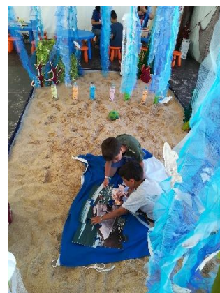
Santa Cruz Ocean Spirit, Torres Vedras