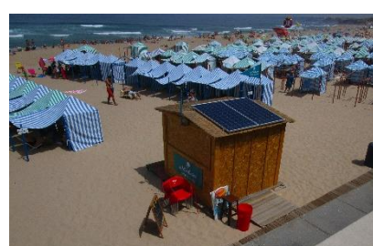
Centro, Torres Vedras