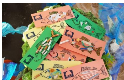
Santa Cruz Ocean Spirit, Torres Vedras