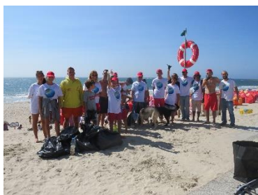
Praia de Ofir, Espinho