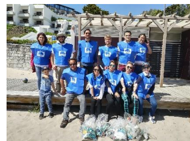
Formação Concessionários, Sesimbra