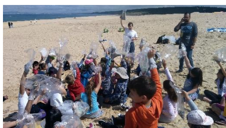
Os Suspeitos do Costume, Lagoa de Albufeira