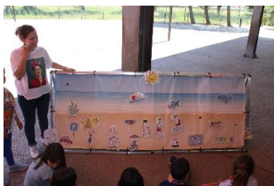
Dia da Família., Escola do Alto da Faia