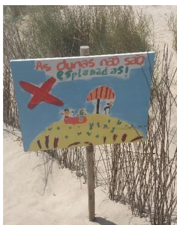
São João da Caparica, Almada