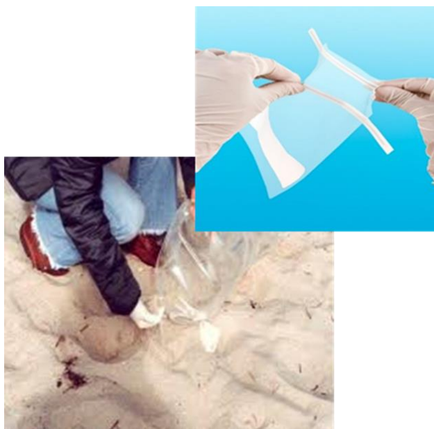
Figura 2 – Esquema ilustrativo da colheita de amostras de areia em praias